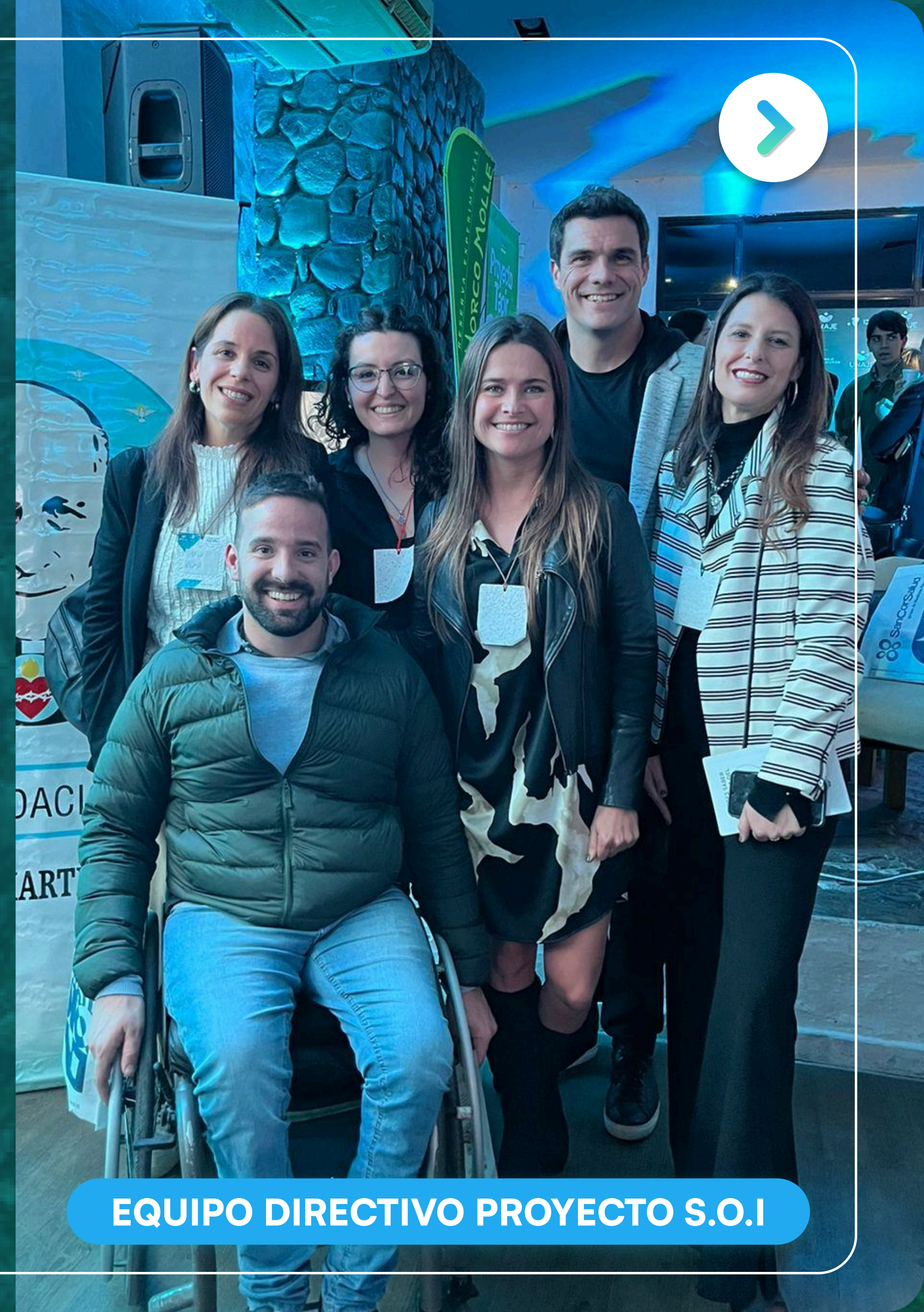
EQUIPO DIRECTIVO PROYECTO S.O.I