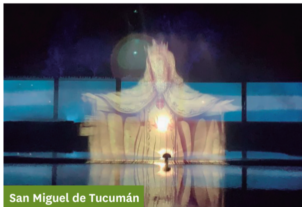
San Miguel de Tucumán

Lugar: Sala del Bicentenario (Laprida esq. San Martín). Horarios: martes a viernes: 15, 17 y 19 hs. Sábados: 17, 19 y 21 hs. Domingos: 18 y 20 hs.