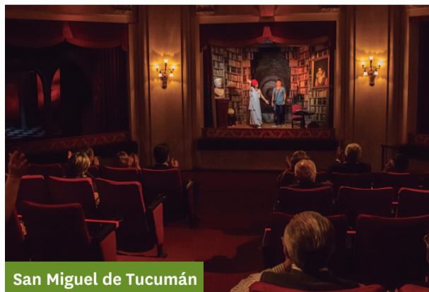
San Miguel de Tucumán